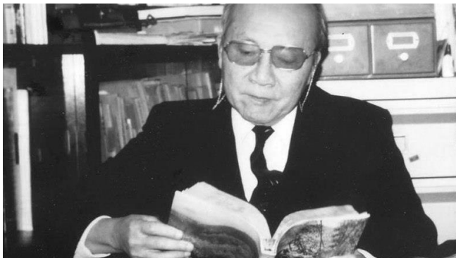
Giáo sư, Học giả Hoàng Xuân Hãn